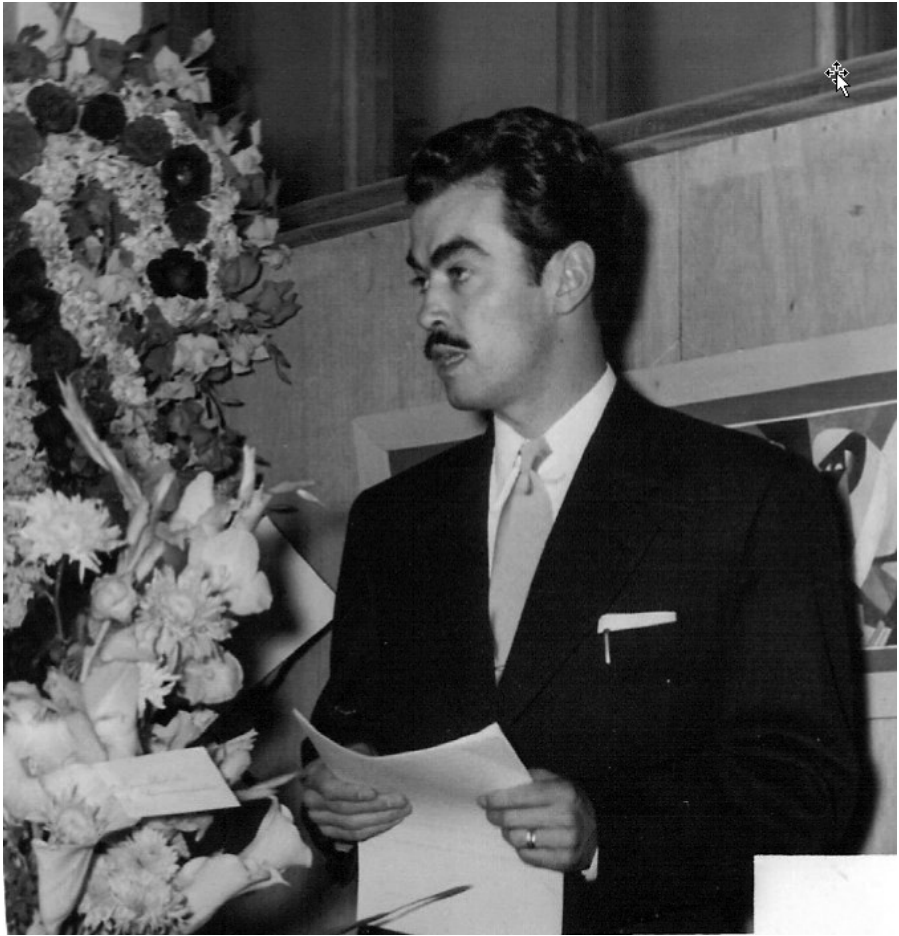
Discurso como presidente de la Asociación de Estudiantes de Humanidades ante la agresión estadounidense contra el gobierno de Arbenz en 1954. (Álbum de la familia Martínez Peláez.)