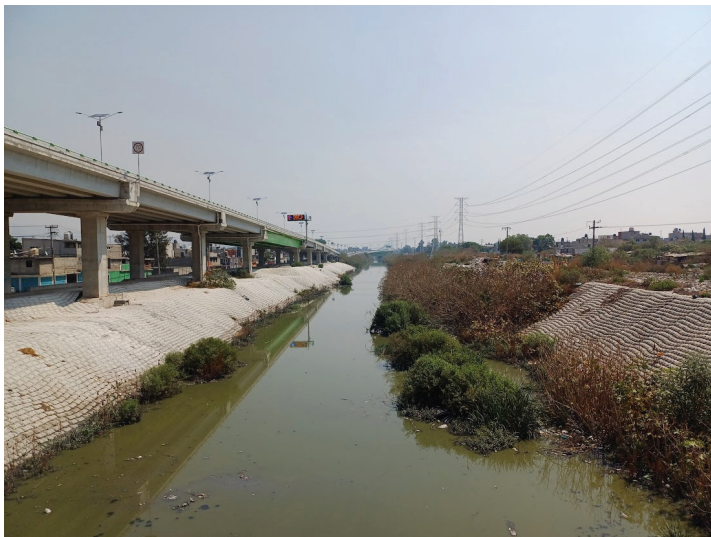
Figura 1. El Gran Canal a la altura de la colonia Altavilla, Ecatepec. Mayo de 2024.

Conocida como Gran Canal, esta zanja hoy se encuentra enclavada entre cientos de asentamientos urbanos al norte de la metrópoli. Pero anteriormente fue una zanja en medio de un paisaje rural y lacustre, al cual contribuyó a desagüar (ver Figura 2).