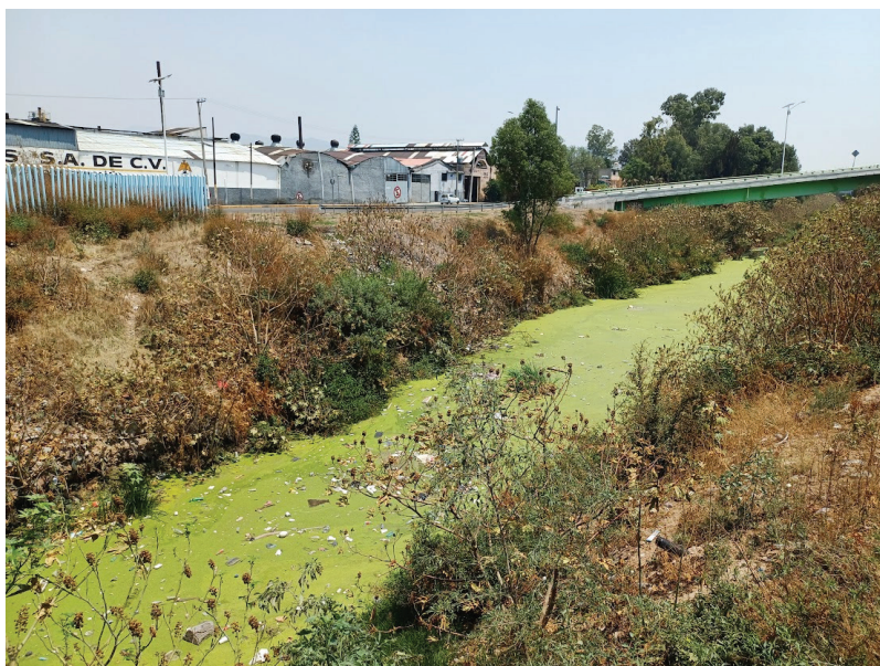
Figura 5. Bodegas industriales a la orilla del Gran Canal, mayo de 2024.

carácter de género, y las relaciones de género y la sexualidad están, a su vez ‘espacializadas’”. En este sentido, la zona industrial que se fue perfilando a las orillas del Gran Canal, así como de la infraestructura ferroviaria que corre paralela a ésta, fue un espacio hecho para las relaciones sociales de producción y el tránsito de mercancías, mas no para las actividades de reproducción social y “por su carácter relativamente estable, la arquitectura, tiende a reflejar las relaciones de género de épocas pasadas” (McDowell, 2000: 173) (Ver Figura 5).