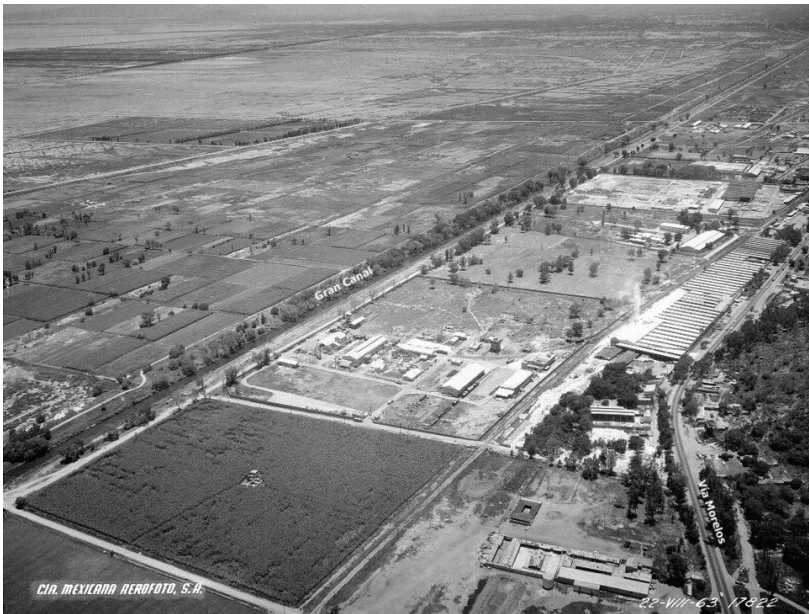
Figura 4. La zona industrial de Xalostoc, en Ecatepec, en el año de 1963. Comienzan a verse los primeros asentamientos urbanos a las orillas de Gran Canal y el cinturón industrial, aunque es predominante aun un paisaje rural en el lado oriente del canal, en el vaso del lago de Texcoco.

La magnitud del emplazamiento de estas nuevas empresas, hizo del municipio uno de los más industrializados del país en aquella época. Esto trajo aparejado, durante las décadas de los cincuenta hasta los ochenta, el incremento de la densidad poblacional. Durante la década de 1950, el municipio de Ecatepec contaba con 15,226 habitantes, la mayor parte del territorio se destina al uso agrícola. Entre 1960 y 1970, pasó de 40,815 a 216,408 habitantes (Araiza, 2016). Es importante anotar que alrededor de los corredores y parques o fraccionamientos industriales crecieron, desde los años cincuenta, algunas de las primeras colonias populares de Ecatepec, de manera similar como ocurrió con las colonias del ex Vaso de Texcoco (Bassols y Espinosa, 2011) (Ver Figura 4).