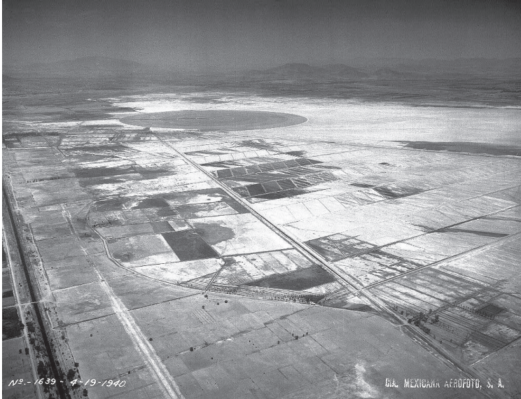
Figura 2. Aerofoto de la zona del Caracol en Ecatepec en 1940. En el extremo inferior izquierdo puede verse la zanja correspondiente al Gran Canal de Desagüe.

El Gran Canal hace parte de un proyecto de drenaje más amplio, al que se conoce como el Desagüe General del Valle, de cuarenta y ocho kilómetros; un sistema de canales y túneles (Figura 3) que se alimentaba no sólo de los ríos y lagos que atravesaba en su recorrido, sino también de un nuevo y moderno sistema de alcantarillado, inaugurado en 1903, que recogía las aguas pluviales y residuales de la ciudad y las vertía en la desembocadura del Gran Canal, que comenzaba en la puerta oriental (garita) de San Lázaro. Pero no fue del todo nuevo, se basó en, y amplió radicalmente, siglos de esfuerzos de la era colonial para expulsar el agua de la cuenca a través del Tajo de Nochistongo, su antecedente más inmediato y el más importante proyecto de desagüe colonial (Candiani, 2017; Chahim, 2021). Así, el Gran Canal hace parte de las infraestructuras