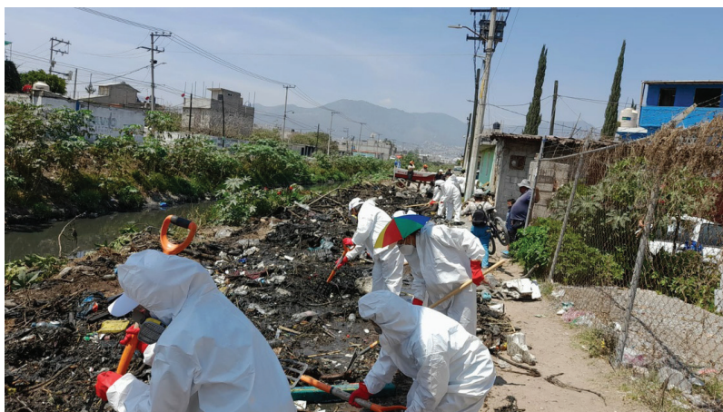
Figura 6. Personas del colectivo “Madres buscando a sus hijxs” en jornada de búsqueda en el Canal de Cartagena (afluente del Gran Canal), en la colonia Potrero del Rey, Ecatepec. Marzo de 2024.

muchas veces se encuentran estos hallazgos de partes de cuerpos humanos. El informe de I(DH)EAS (2018: 51) especula que el patrón, tanto temporal como espacial, que sigue la concentración de casos de mujeres jóvenes y niñas desaparecidas en la entidad, apuntan hacia la existencia de un circuito o cordón que se articula a los municipios de Ecatepec, Nezahualcóyotl, Toluca, Cuautitlán Izcalli y Chimalhuacán, precisamente aquellos con el mayor número de organizaciones criminales. De esta manera, estudios como el de la organización I(DH)EAS (2018) y la Red por los Derechos de la Infancia en México (2021), han sugerido que el fenómeno de la desaparición puede estar fuertemente vinculado, junto al feminicidio, a la trata de personas, sobre todo de migrantes, niñas y adolescentes, para fines de explotación sexual, actividades criminales o adopción ilegal.